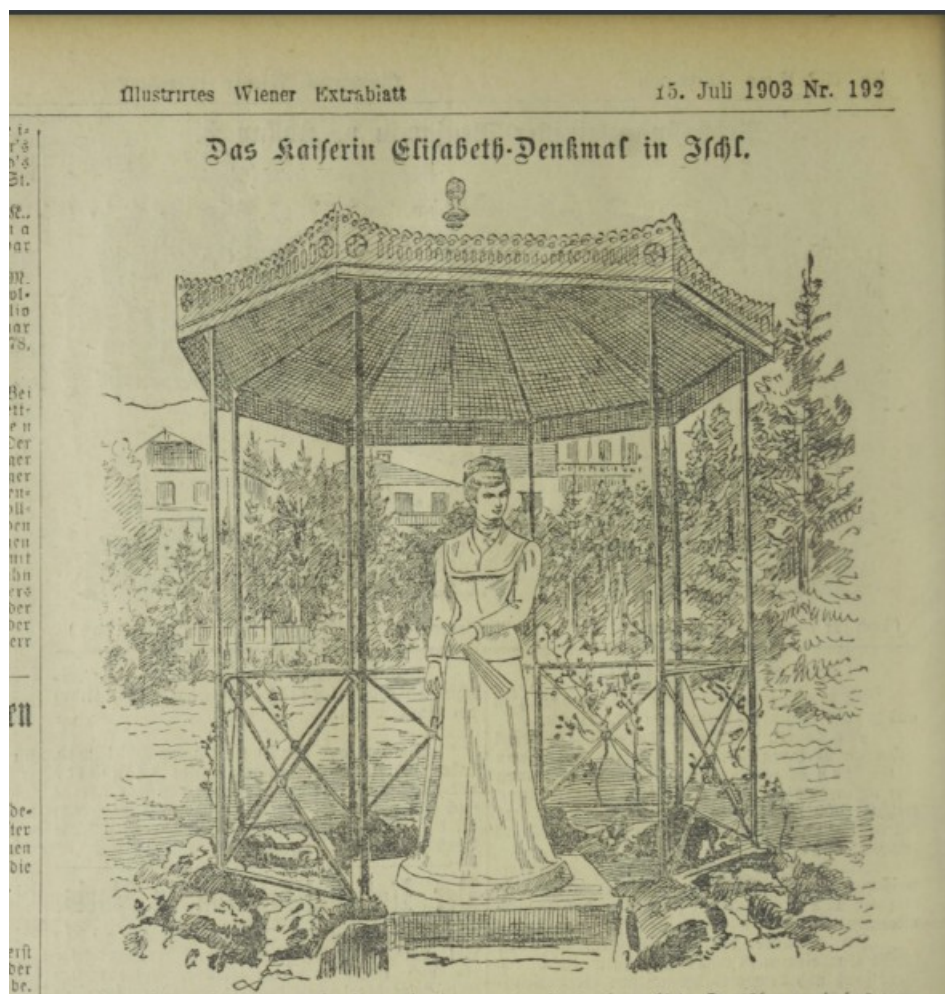
Socha císařovny Elisabeth v altánku u hotelu Rudolfshöhe – původní umístění Výšlo v novinách Illustriertes Wiener Extrablatt 15. Juli 1903 Nr. 192